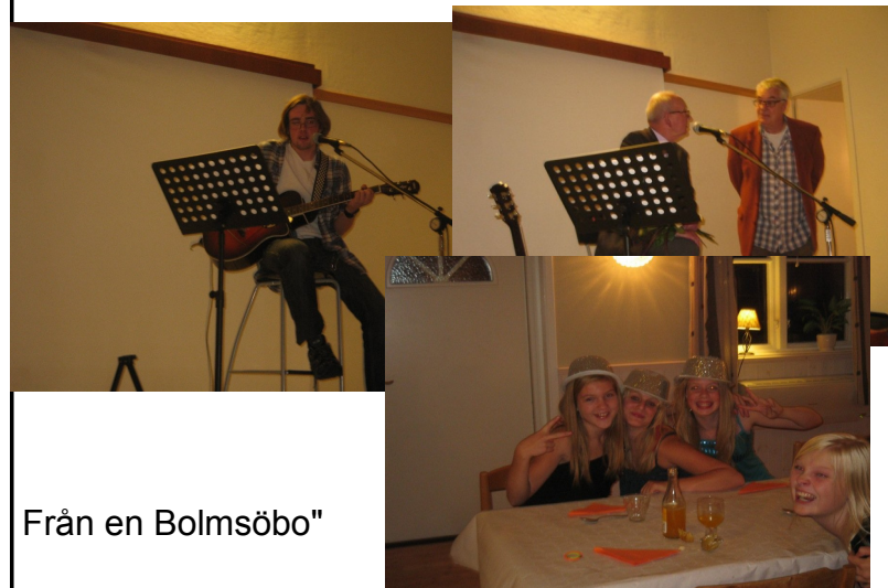
Från en Bolmsöbo"

" Tack för en trevlig skördefest i Tannåker.